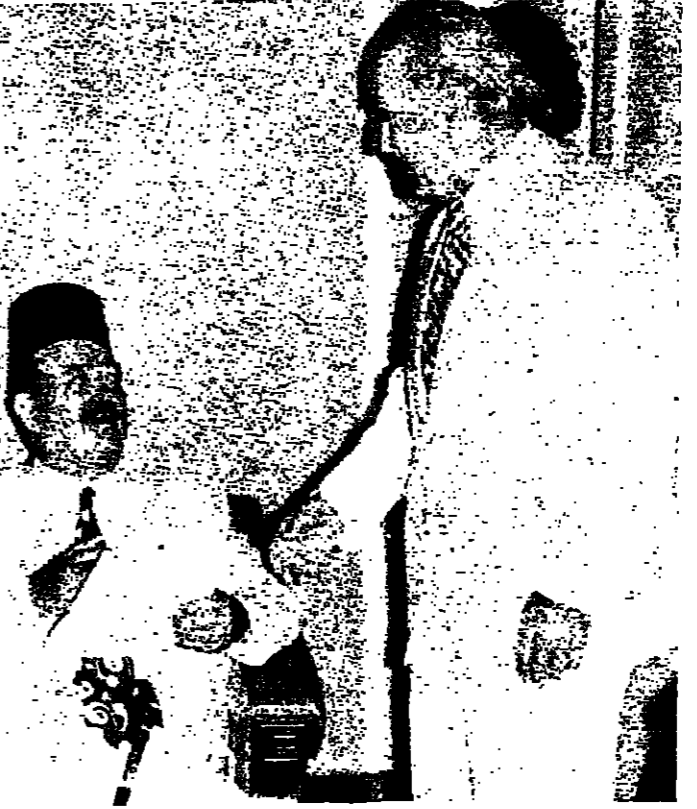
حدث بين الرئيس سلام والإبراهيم أرسلان

عند فتح باب المناقشة .. ١٧٠٠٠ صوتا .. ١٧٠٠٠ صوتا .. ١٧٠٠٠ صوتا .. ١٧٠٠٠ صوتا ..